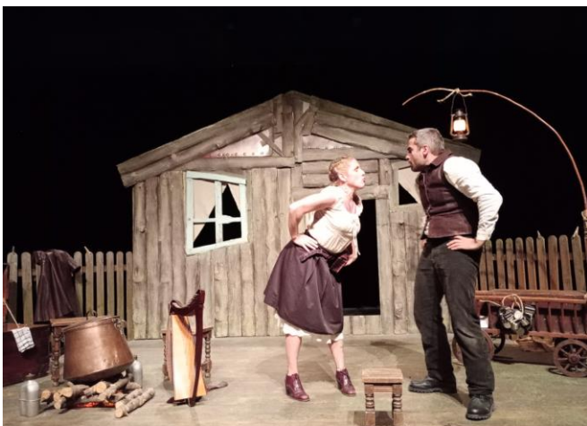
Par Clotilde Moulin et Théo Lanatrix

Comme chaque année, le Comité des Fêtes en partenariat avec la commune vous offre un spectacle qui s'adresse à tous.